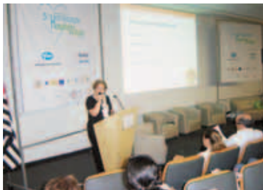
V Congresso de Humanização Hospitalar