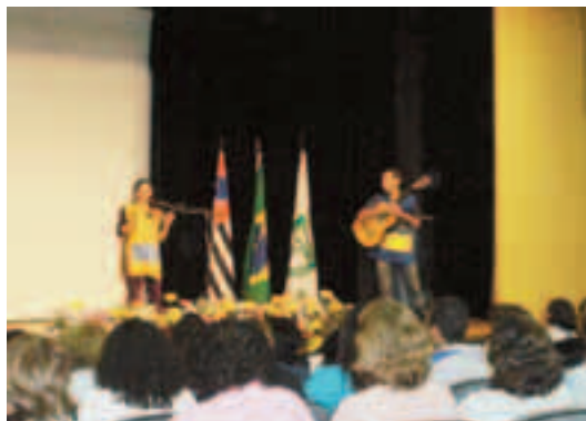
Curso de Voluntariado GRAACC/IOP