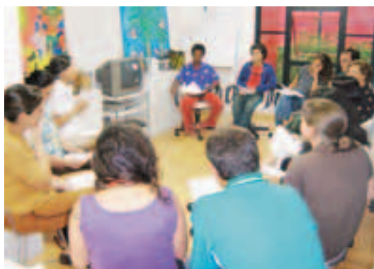
Atividades arte educativas com a equipe técnica