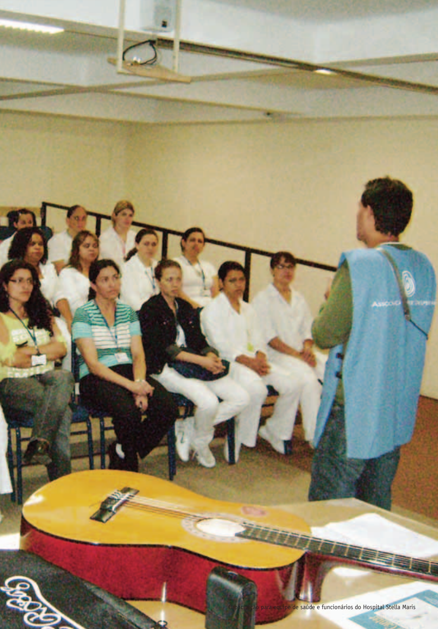
Capacitação para equipe de saúde e funcionários do Hospital Stella Maris