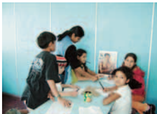
Capacitação para educadores