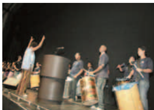
Show de abertura da banda Cidade Negra