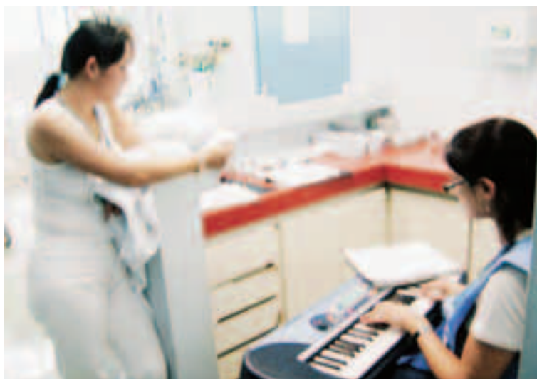
Atividade arte educativa com música para equipe de saúde do HMU

Atendimentos em humanização: 214 Duração: 12 meses Início: julho/2007