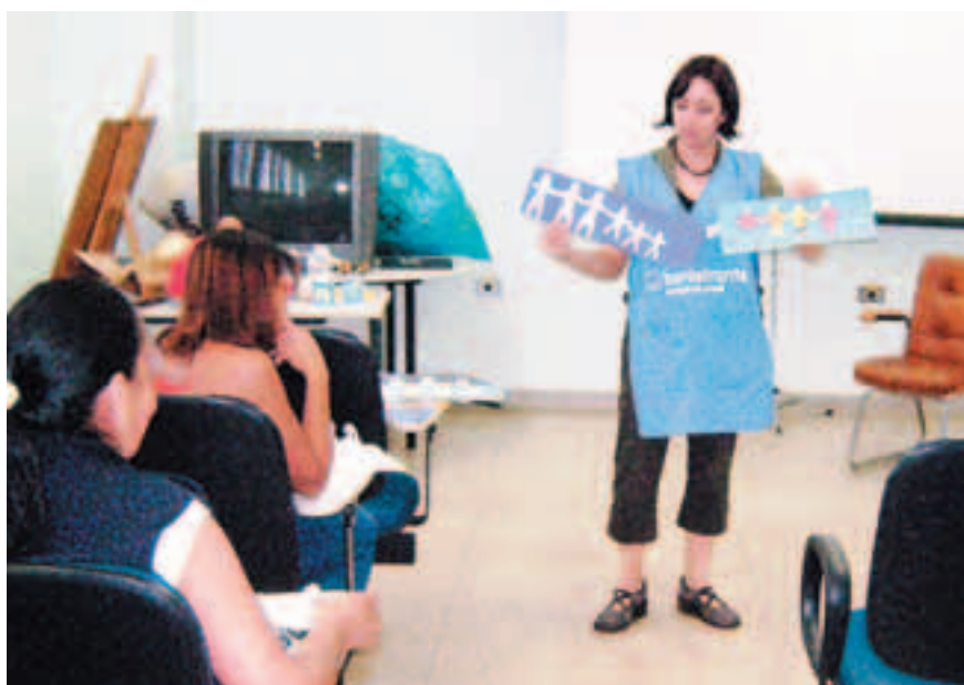
Capacitação para equipes de saúde e funcionários do HJJM