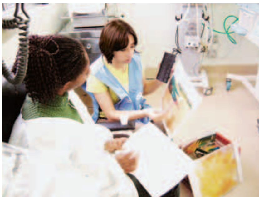
Atividade arte educativa com artes visuais na UTI pediátrica do HMC

Atendimentos em humanização: 324 Duração: 12 meses Início: julho/2007