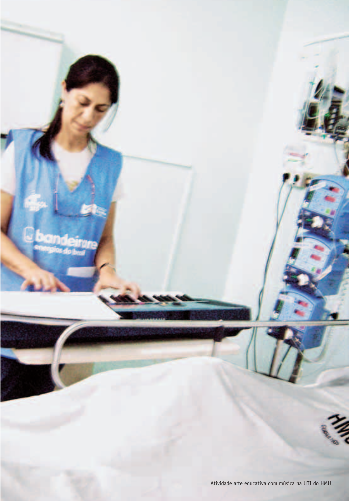
Atividade arte educativa com música na UTI do HMU