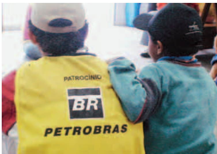
Capacitação para jovens de Paraisópolis

Capacitação: 76 atendimentos 246 atendimentos realizados pelos jovens capacitandos Duração: 12 meses Início: janeiro/2006