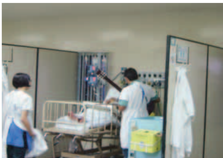
Atividade arte educativa com música e arte visuais

Atendimentos em humanização: 652 Duração: 12 meses Início: julho/2007