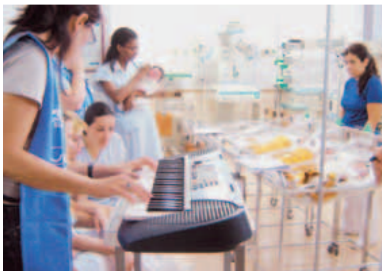
Atividade arte educativa com música na UTI neonato do Hospital Stella Maris

Atendimentos em: Humanização: 415 Capacitação: 74 Duração: 12 meses Início: julho/2007