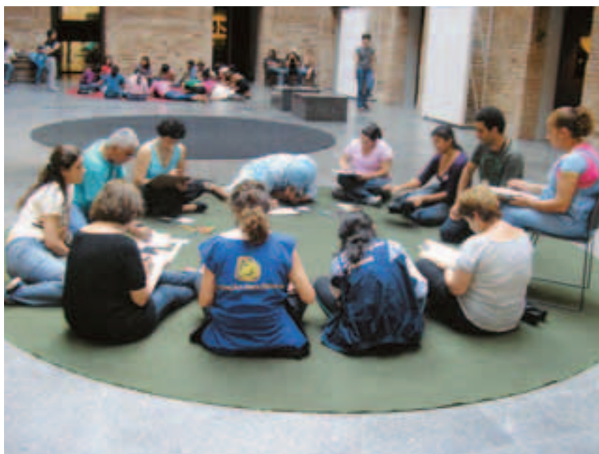
Atividade na Pinacoteca