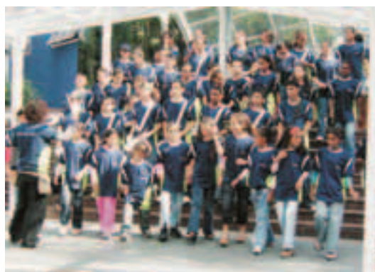
Impact Day na empresa Deloitte