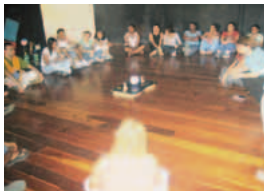
Capacitação e reciclagem para funcionários