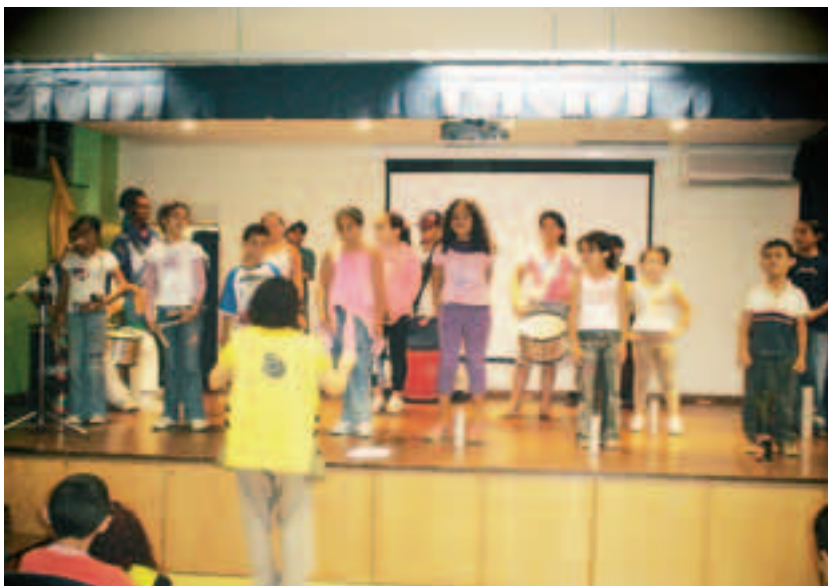
Atividade de música em Paraisópolis

Atendimentos: 1.442 Duração: 12 meses Início: abril/2007